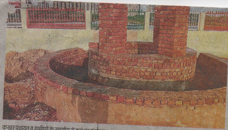
कसार पंचायत व ग्रामीणों के सहयोग से कुएं का यूँ ही रहा कायाकल्प।

क्षेत्र ओं की लिए आरा गांव कुएं को काया गया रममत फ़सार काम चल आं तो पहुंच चुका में भी के लिए