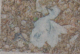
सुलखनी गांव के जलघर में मृत पड़ा पक्षी।

संवाद सहयोगी, हांसी : सुलखनी गांव में स्थित जलघर में बीते दो दिनों से पक्षियों की रहस्यमय परिस्थितियों में मौत हो रही है। ग्रामीणों का कहना है कि जलघर में लगे पेड़ों पर बैठे बगुलों की मौत हो रही है। पिछले 2 दिन से कई बगुलों की मौत हुई है। बगुल लगता तो रहीं मौत से ग्रामीण भी चिंतित हैं कि आखिर पक्षियों की मौत किस कारण हो रही है। बीते कुछ दिनों से जलघर के पेड़ों पर रहने वाले बगुलों अचानक पेड़ से नीचे गिर जाते हैं व नीचे गिरते ही उनकी मौत हो रही है। ग्रामीणों ने प्रशासन को सूचना देकर मांग करते हुए कहा कि गांव के जल घर में पंहुंच कर प्रशासन बगुलों की हो रही मौत का पता लगाकर इसका समाधान करें।